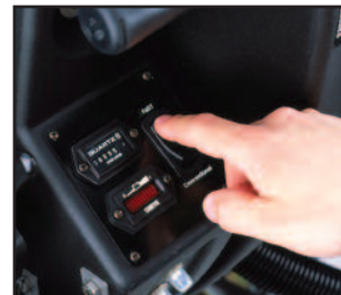
Bouton de commande unique