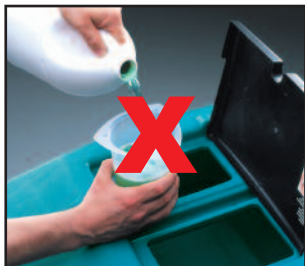
Plus de mélanges compliqués

FaST fait tout le travail automatiquement distribuant le dosage correct dès la première fois et à chaque fois. Assurant ainsi un procédé de nettoyage parfait, efficace sur toute la surface du bâtiment, quelque soit les rotations d'équipes.